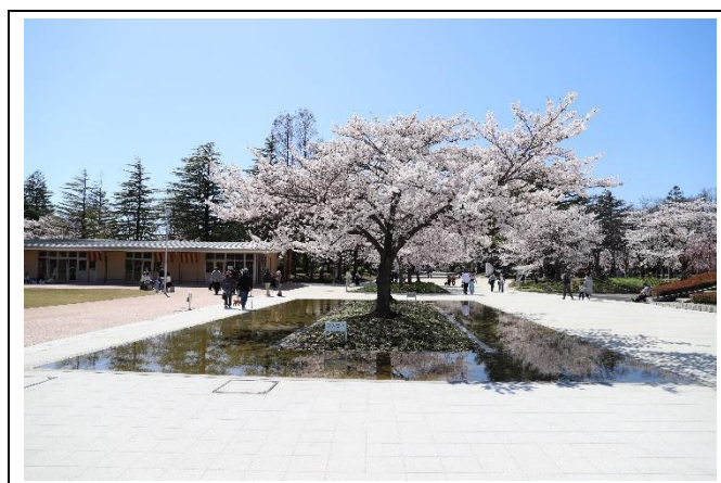
開成山公園